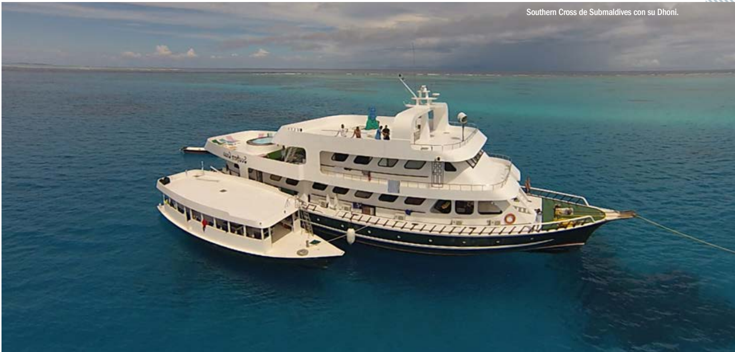
Southern Cross de Submaldives con su Dhoni.

¿Y qué decir de la nocturna con tiburones nodriza? Ni el más experimentado de los buceadores puede llegar a imaginar una concentración semejante de estos pacíficos animales, pero tampoco su loco frenesí cuando hay alimento en juego. Atraídos por los restos de pescado que arrojan cada día los pequeños pesqueros desde un pantalán, los tiburones se han acostumbrado a acudir allí cada día a la puesta del sol, en busca de su botín. Es un espectáculo grandioso verlos llegar por decenas convocados por la llamada del principal instinto animal, alimentarse. Ni los focos, ni la presencia de los buceadores, logra despistarles de su objetivo ante la asombrosa cara de sorpresa que se pinta en todos los que hacen esta inmersión por primera vez. Es lo nunca visto y el recuerdo de lo visto queda incrustado para siempre en nuestra memoria. ■