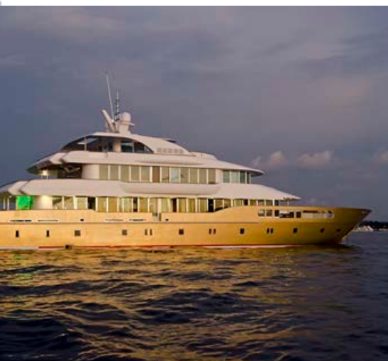
El barco Maldives Crown es la opción más exclusiva de la flota Submaldives.

de Maldivas con incontables inmersiones y descubrimientos, juntos creamos la empresa Submaldives, que ha ido creciendo con los años.