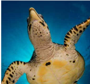
Las tortugas pico de halcón, se muestran curiosas y confiadas.

Somos la única compañía que opera todo el año, porque en Maldivas, al contrario de los que algunos piensan, se puede bucear en cualquiera de las dos estaciones. Sólo hay que conocer bien las corrientes y los vientos predominantes en cada una de ellas, para seleccionar las mejores inmersiones en cualquier momento de año, y eso es lo que disfrutamos haciendo cada día. Gracias a eso puedes ver el tiburón ballena y las mantas raya con nosotros, vengas en el momento que vengas.