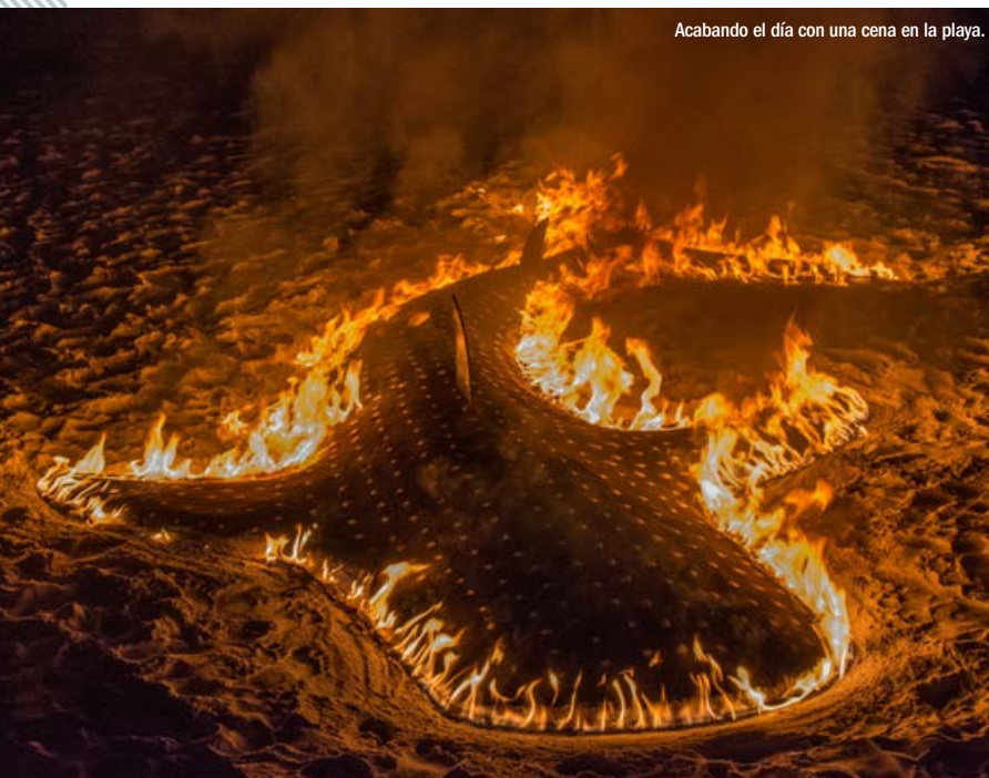
Acabando el día con una cena en la playa.