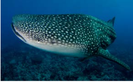
Cara a cara con el tiburón ballena con botella.