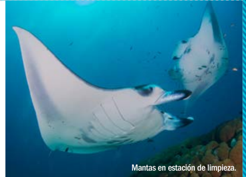
Mantas en estación de limpieza.