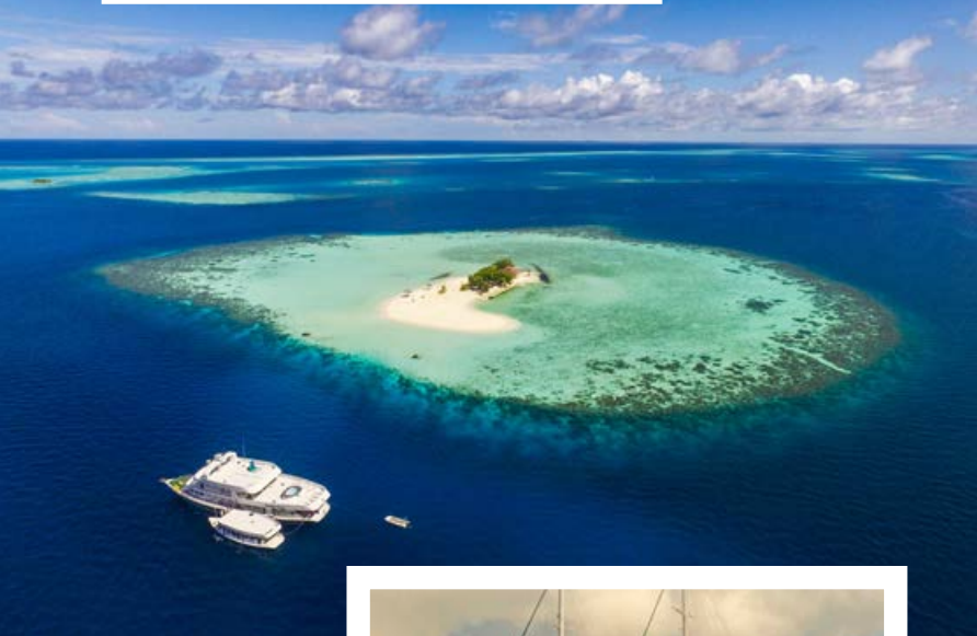
Atolones e islas desiertas forman el paisaje de Maldivas.