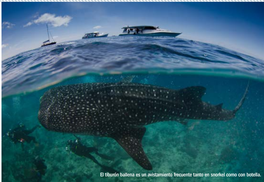
El tiburón ballena es un avistamiento frecuente tanto en snorkel como con botella.