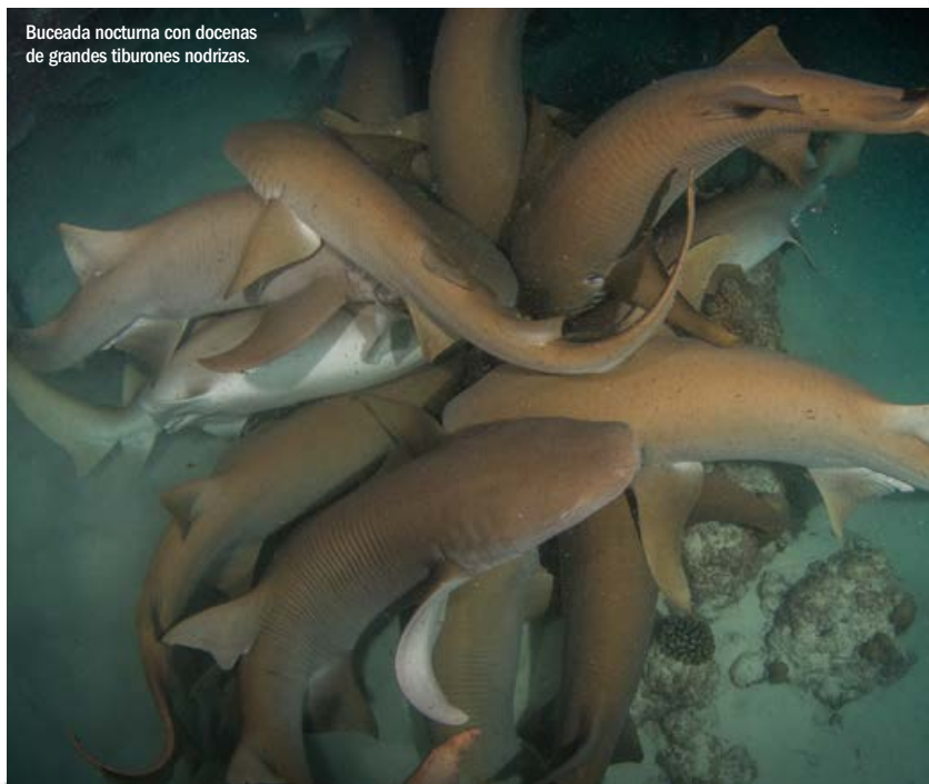
Buceada nocturna con docenas de grandes tiburones nodrizas.