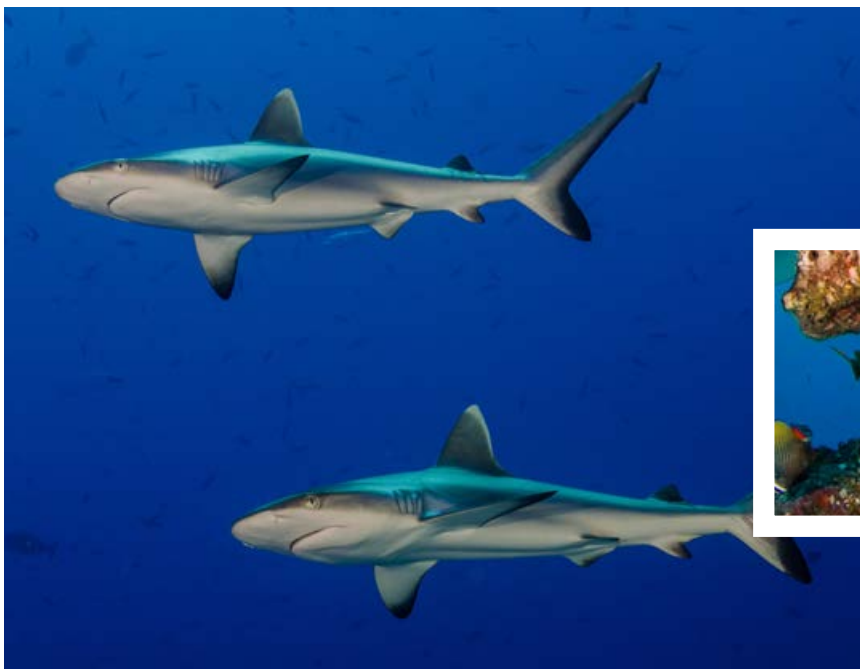
En la entrada de los canales de los atolones se bucea con corrientes para ver tiburones.

Nuestra joya de la corona ha convertido a Submaldives, con cuatro barcos en propiedad, en la mayor compañía de buceo (vida a bordo) de Maldivas, la de más experiencia y la única con participación española.