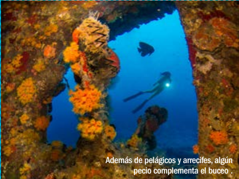
Además de pelágicos y arrecifes, algún pecio complementa el buceo.