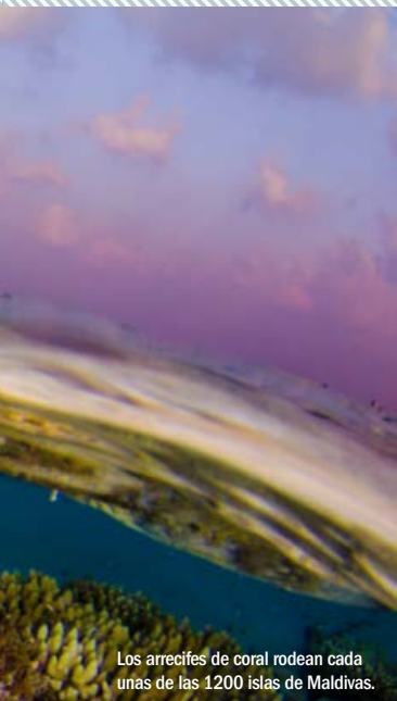
Los arrecifes de coral rodean cada una de las 1200 islas de Maldivas.