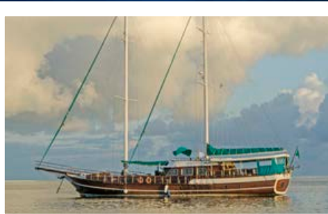
El barco Veela de Submaldivas ofrece un servicio personalizado para grupos pequeños.