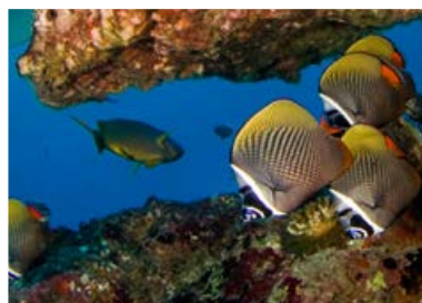
Buceando alrededor de las Thilas encontramos las especies tropicales del arrecife como los peces mariposa.