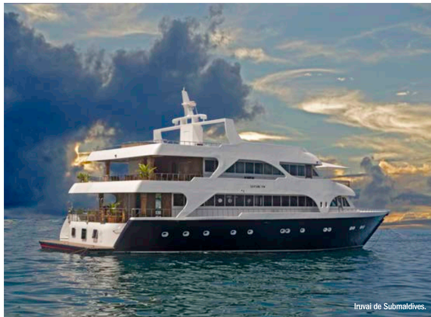
Iruvai de Submaldives.

Descubrir la riqueza de vida submarina que ofrece Maldivas a la luz de los focos es un paseo nocturno fascinante. Sobre todo, si lo hacemos rodeados de decenas de mantas, tiburones nodriza o el fascinante tiburón ballena. Son las dos inmersiones estrella que sólo podemos encontrar en un lugar en el mundo. Aquí.